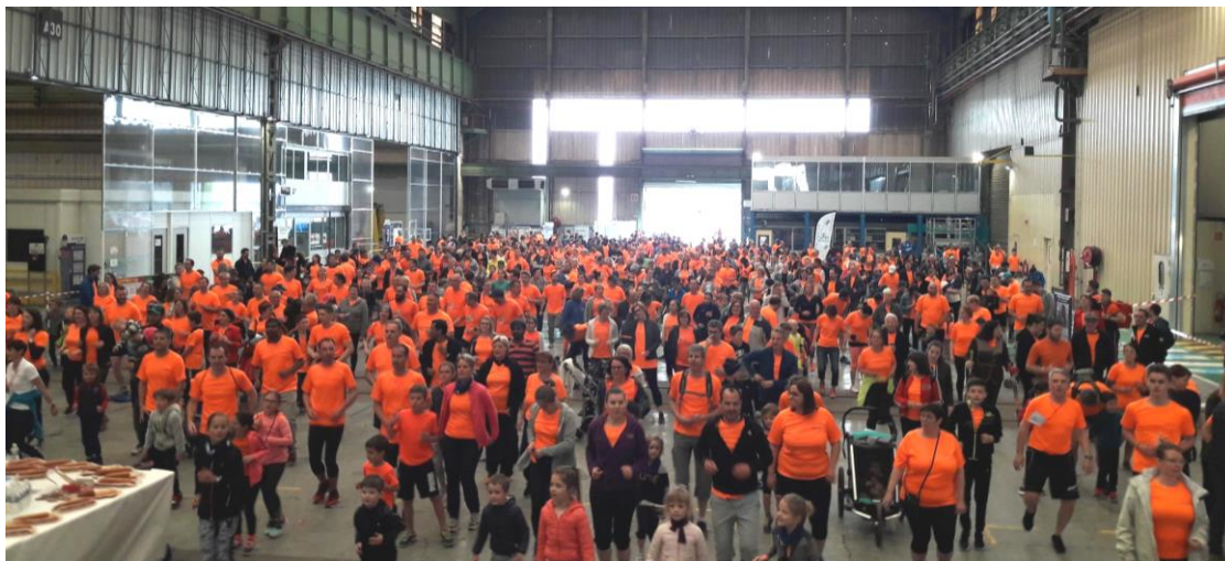
Vue d'ensemble pendant l'échauffement collectif

Devant le succès de cet événement, la direction du site de Valenciennes a décidé de confier à l'équipe organisatrice l'édition 2020.