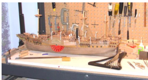
L'ORENOQUE sur mon établi à HORNELL

Alors les loisirs à part le ski il faut de l'imagination ! J'avais reçu un portable en cadeau lors de mon départ et après bien des « bidouillages » j'ai réussi à maîtriser l'engin, enfin partiellement. Au cours de mes navigations je suis tombé sur des sites de maquettes de bateaux. J'ai craqué pour un hors-bord. A titre d'essai je l'ai réalisé : cela n'a pas été une réussite mais j'ai appris les bases. Durant les 5 années suivantes. J'ai construit 3 autres bateaux : jugez du résultat.