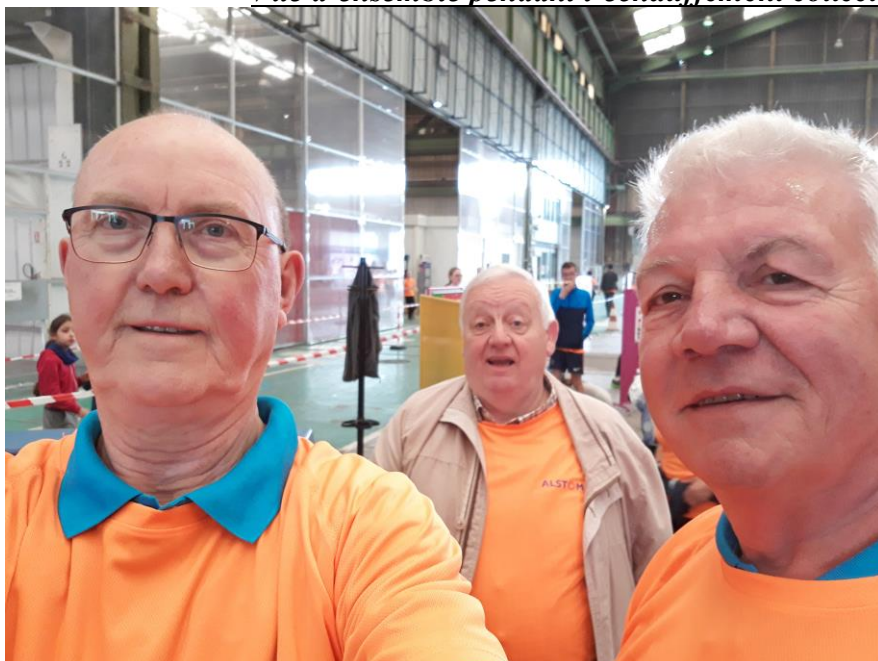
Les membres de notre Amicale