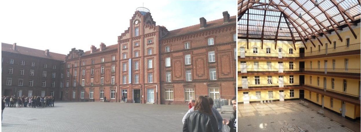
S.et B. CHEVAL

17h30, après le verre de l'amitié, nous reprenons le chemin du retour. Nous avons passé une très bonne journée.